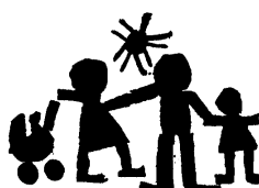
ELKI-Gruppe St. Michael

Uhr in der Bäckerei P. Müller, Maihof Luzern. Für Kinder ab 3 Jahren. Teilnehmerzahl beschränkt, nur mit Anmeldung. Palmbaumbinden: Samstag, 24. März 2018, 09:00 bis 11:30 Uhr im Pfarreiheim St. Michael. Palmweihe: Sonntag, 25. März 2018, 10:30 Uhr in der Kirche St. Michael. Kino-Tag: Mittwoch, 18. April 2018, 14:00 bis 16:00 Uhr für Kinder von 6 bis 10 Jahren, ab 19:00 Uhr für Frauen. Jeweils im Pfarreiheim St. Michael, Eintritt CHF 5.–. Weitere Infos unter: elki.populus.ch .